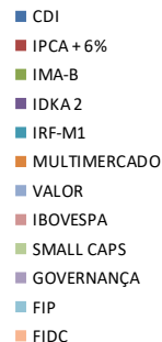
Diversificação por Categoria de Ativos