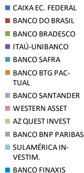
Diversificação por Instituições Financeiras