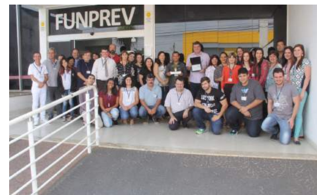
Visita do Prefeito à Funprev

Na ocasião, Gazzeta recebeu a placa de reconhecimento pela conquista do prêmio.