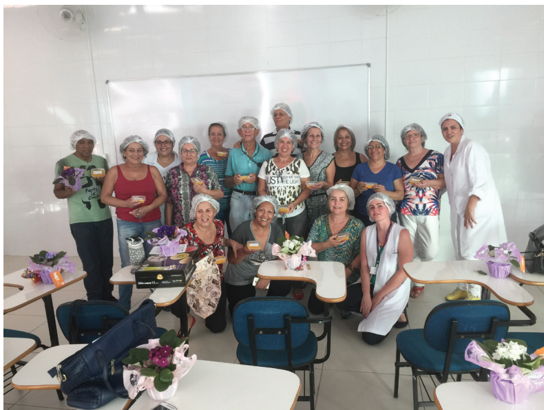
Participantes confraternizam no encerramento do evento no dia 14 de junho

O Programa tem como objetivo contribuir na melhoria da qualidade de vida dos segurados do RPPS promovendo a saúde e prevenção de doenças nesta fase de vida de seus segurados objetivando o envelhecimento ativo dessa população.