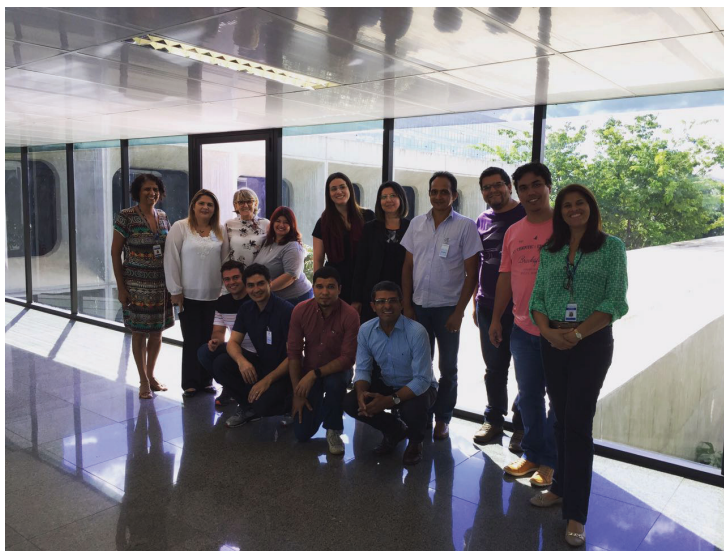
Ministério da Fazenda - Secretaria de Previdência

Suas principais vantagens são: gratuidade; código aberto; treinamento gratuito oferecido pelo Ministério da Previdência Social; retorno de informações de óbitos, cartórios, vínculos no RGPS, etc, obtidas com o cruzamento dos dados do RPPS com diversos sistemas sob a Gestão deste Ministério. Disponibilizado no Portal Software Público e mantido pela DATAPREV garantindo a modernização constante do sistema.